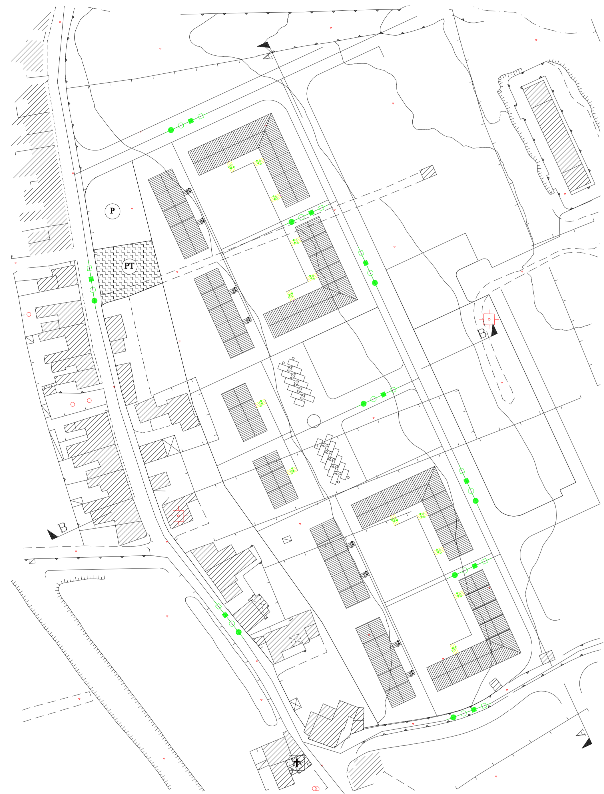
SCHEMA PLANIMETRICO IMPIANTI