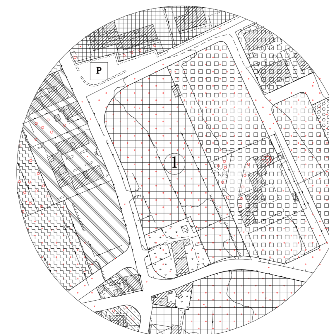
STRALCIO P.R.G. 1:2000