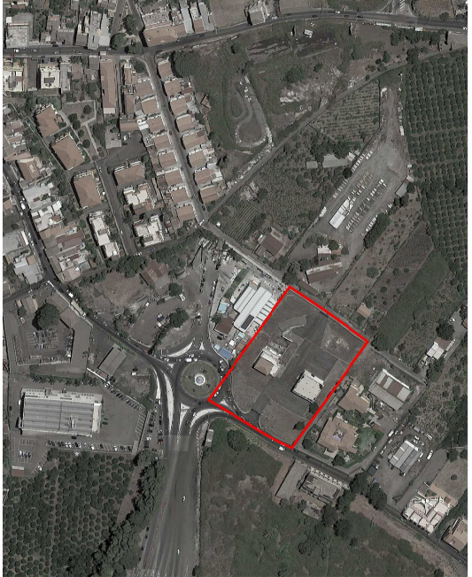
FOTO AEREA MAGGIO 2016